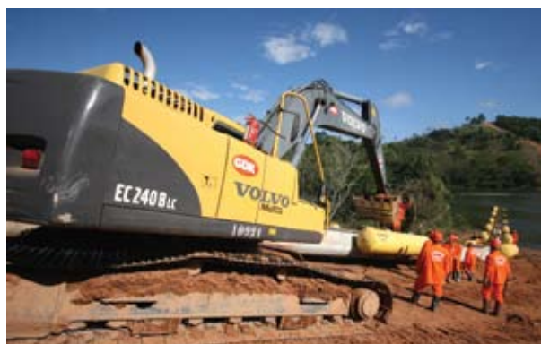
Figura 3. Vista geral do rio Paraíba e preparação da coluna

prazo originalmente previsto, com total segurança do cumprimento do planejamento de construção e sem nenhuma intercorrência que pudesse colocar em risco sua completção.