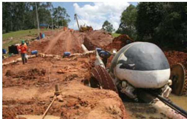
Figura 2. Equipamento post-trenching Eras

O sucesso da solução idealizada e aplicada pela primeira vez no Brasil combinou a criatividade para enfrentar um desafio com a experiência da equipe e a seleção de recursos dos mais atuais, demonstrando a assertividade da metodologia aplicada, minimizando o grau de incerteza naturalmente associado a travessias com elevado grau de dificuldade. A travessia do rio Paraíba, que se constituía em um dos possíveis “gargalos” da implantação do duto foi concluída antes mesmo do