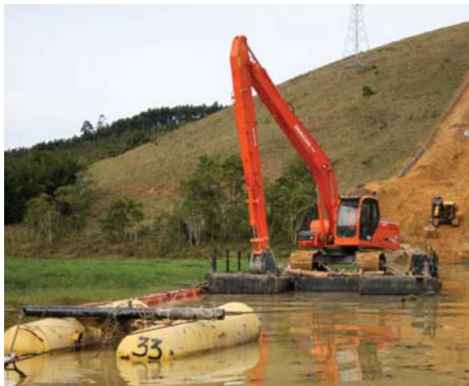
Figura 4. Escavadeira extralonga

e Rio Lourenço Velho, em solos que variavam entre os pantanosos e aqueles com presença de rocha, foram aplicados conjuntos de escavadeiras anfíbias do tipo Kori, com plataforma de escavação das máquinas CAT 320, montadas de forma associada a pontões flutuantes extras – além dos providos pela própria Kori.